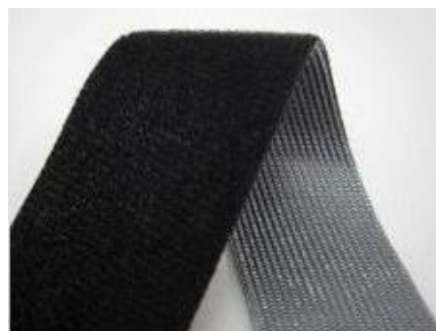
*フック面 / 乳白色 (50mmのみフック面は黒になります)